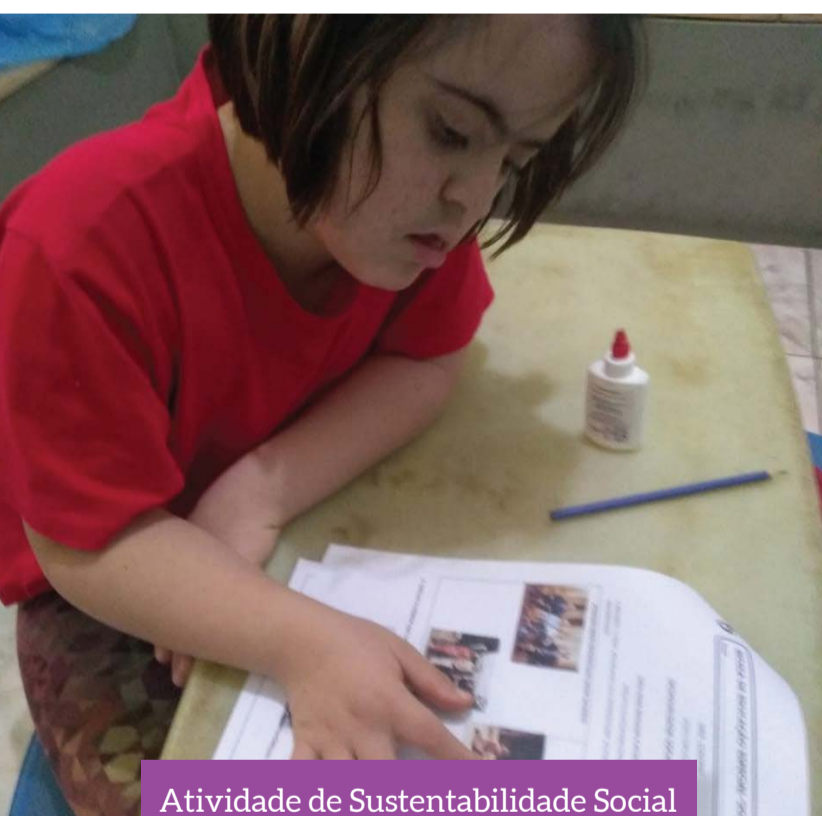
Atividade de Sustentabilidade Social