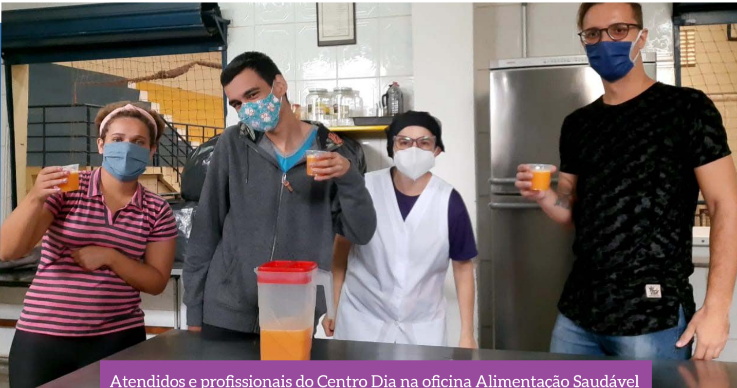
Atendidos e profissionais do Centro Dia na oficina Alimentação Saudável